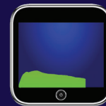
Gráfico de flujo de aliento

A medida que el sujeto sopla en la boquilla, el LX9 mostrará un gráfico del flujo de la respiración en la pantalla.